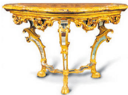
Console Table, 18th Century