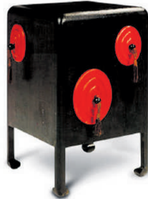
Paul Poiret, 20th Century