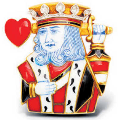
Cartier, ca. 1935