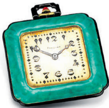
Vacheron Constantin & Verger Frères, 1920