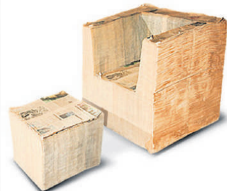
Niels Hvass, 2006

De openingspagina van 1stdibs heeft een etalage waarin de site steeds een aantal nieuwe producten toont.